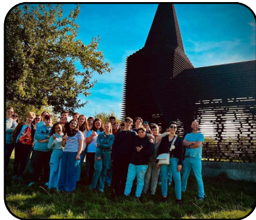
UITSTAP • P. 4