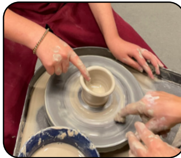
BOKRIJK • P. 7