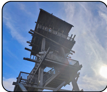
BLOTEVOETENPAD • P. 3