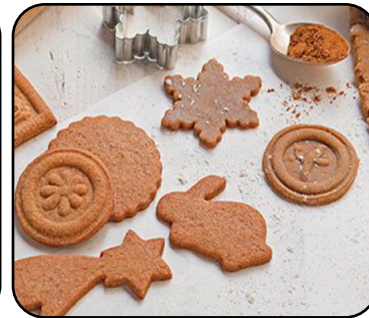
RECEPT • P. 10