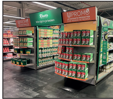
Bedrijfsbezoek • p. 5