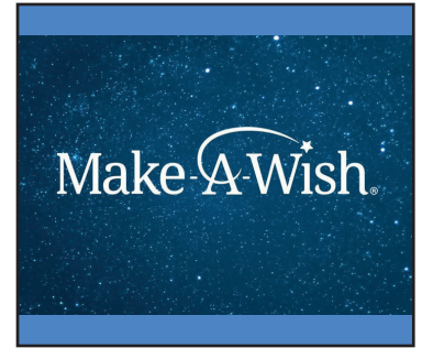
Make-A-Wish • p. 7