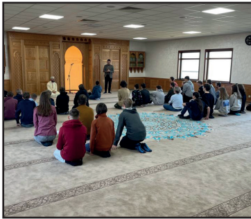
Culturele uitstap • p. 2