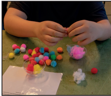
Slotactiviteit • p. 3